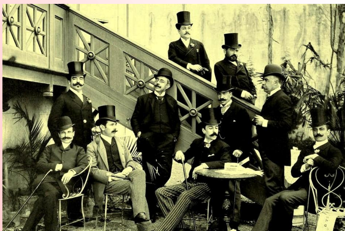
Eça de Queirós no grupo “OS VENCIDOS DA VIDA”.

Eis algumas observações de interesse que Eça de Queirós, a sós ou em parceria com Ramalho Ortigão nas “Farpas”, procurou fazer e que justificam a sua atualidade.